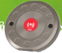
Tischsender für Kellnerruf

Rufsysteme optimieren die Arbeitsabläufe und steigern die Effizienz in Gastronomiebetrieben.