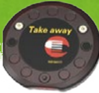
Take-Away-Pager für Gästeruf