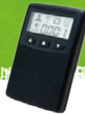
Pager für Kellner